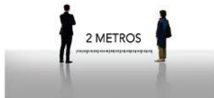
Mantén una distancia mínima de 2 metros de las demás personas