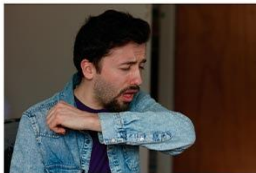
Si estornudas o toses cúbrete con la parte interna del brazo