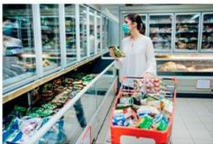
Usa cubrebocas en todo momento

Aplicar las medidas de prevención en todo momento